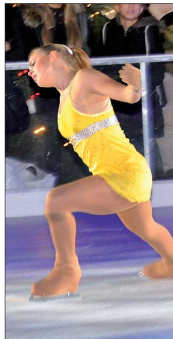
Intensität in Gelb