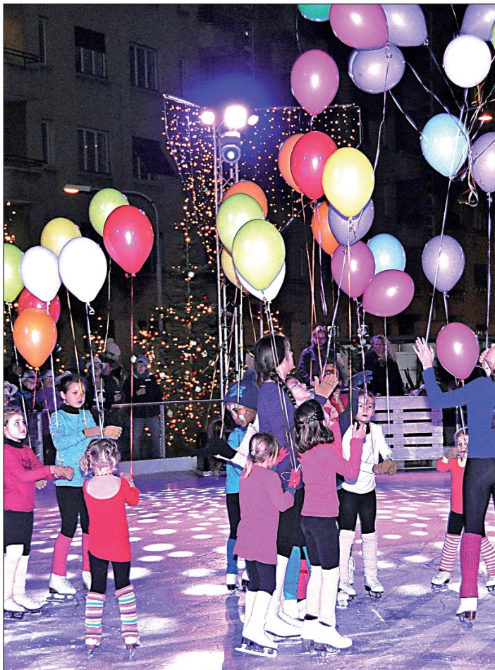
Breitensport in vielen Farben

Wer Lust hat, darf nach der Show selber auf dem Eis seine Runden drehen. Schlittschuhe werden vor Ort