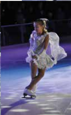
Leistungsgruppe B mit ihrer Show zu «Dark Horse» von Katy Perry.