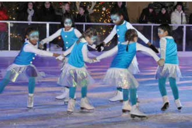
Voller Einsatz unserer Breiten- sportgruppen.