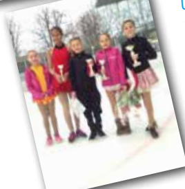
Unser Nachwuchs sicherte sich an der Basler Meisterschaft drei Podestplätze.